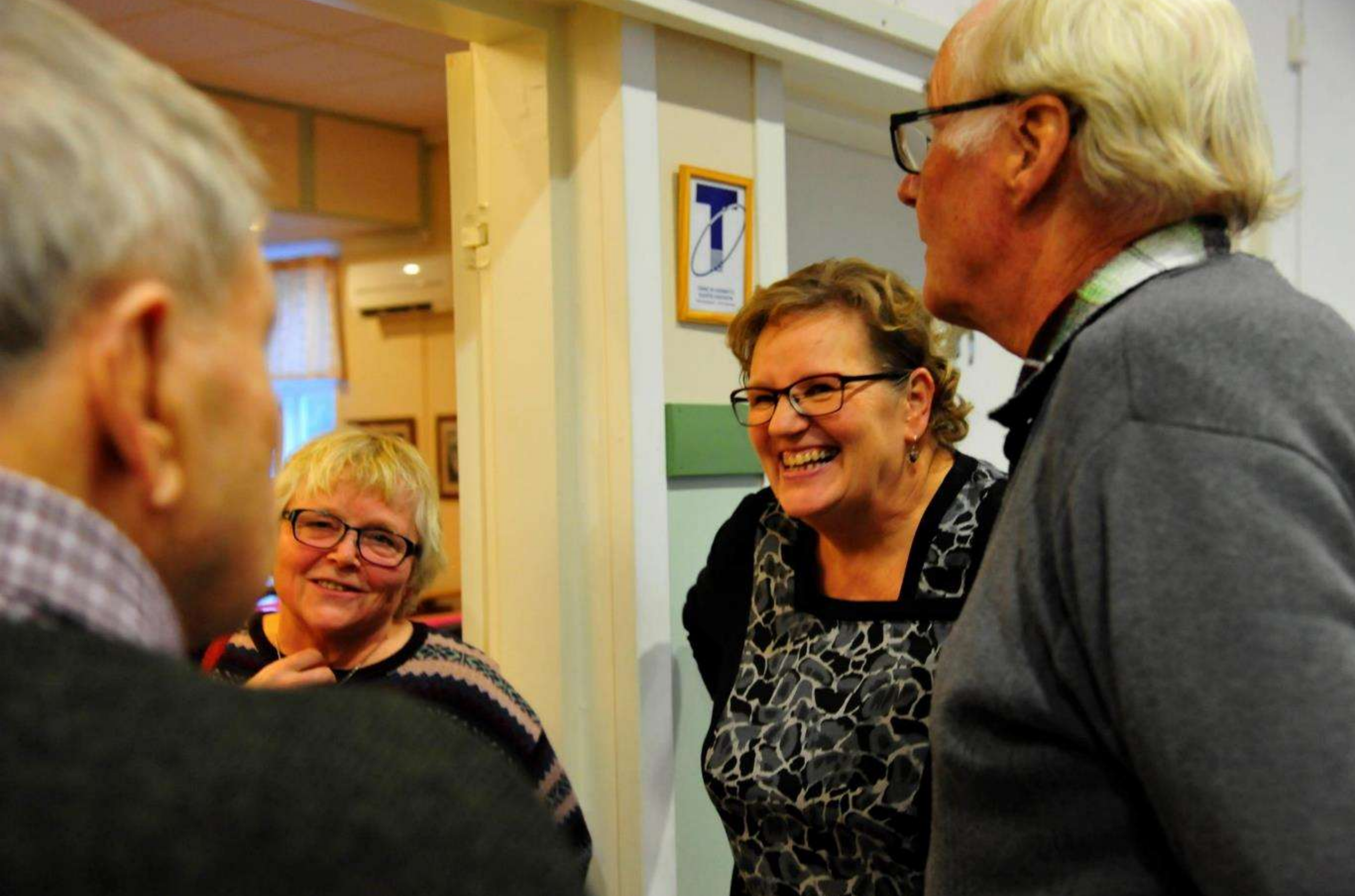
Sorsakosken perinteinen teollisuustaajama & kylätoiminta, Leppävirta Onneksi tiiviin opintoretken ohjelmaan mahtui epävirallisia rupatteluhetkiäkin.