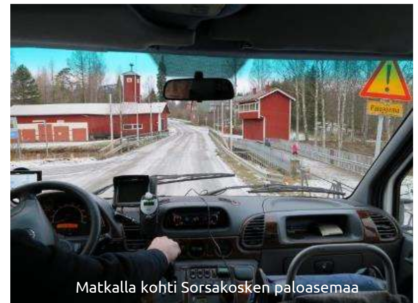
Matkalla kohti Sorsakosken paloasemaa