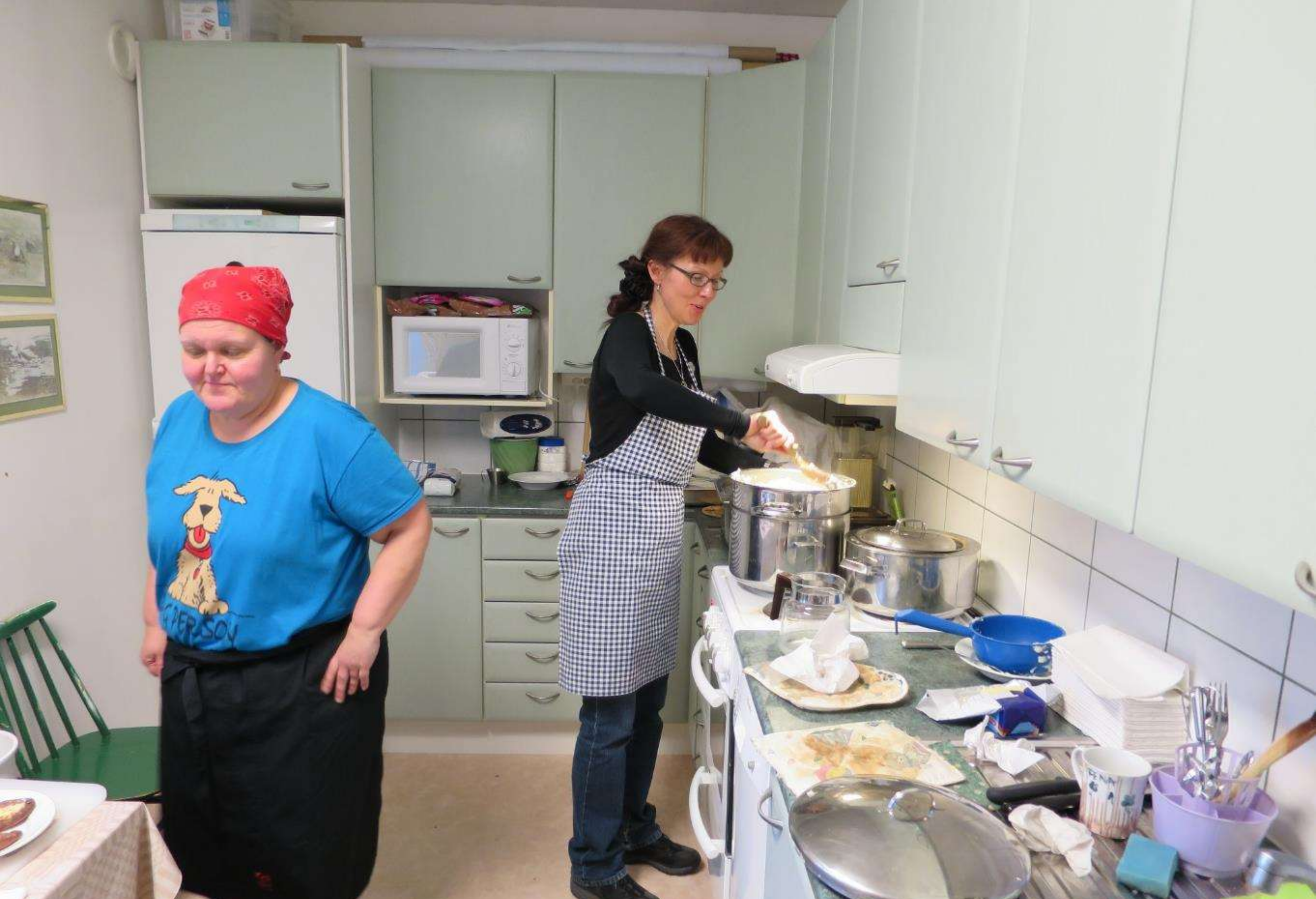
Soinilansalmen kyläyhdistys, Leppävirta Salmitalon joulumyyjäisten puuronkeittäjät työn touhussa.