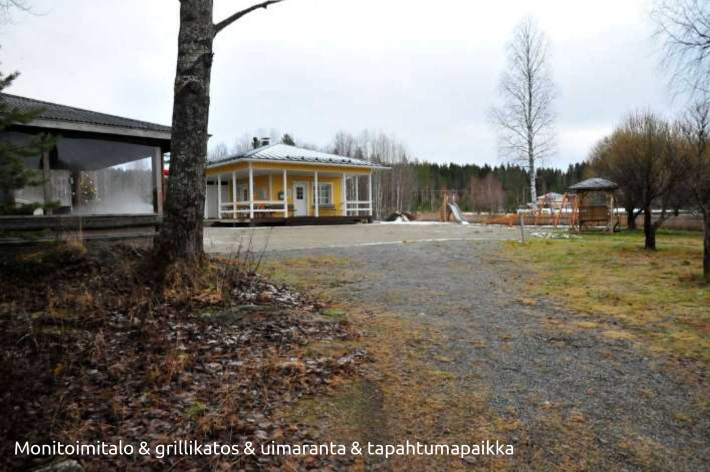
Monitoimitalo & grillikatos & uimaranta & tapahtumapaikka